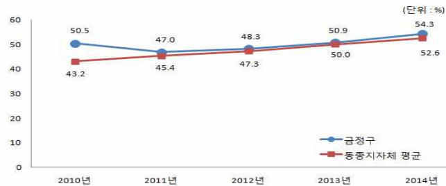
동종 자치단체와 사회복지비 비율 비교

동종단체 대비 사회복지비의 비율이 비슷하며 복지수요 증가, 복지대상 확대 등으로 사회복지비가 총 재정에서 차지하는 비율이 2014년 54.34%이며 매년 증가하고 있습니다.