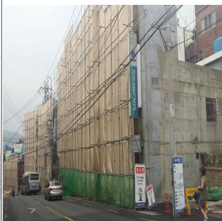
서동로 5차 사업구간