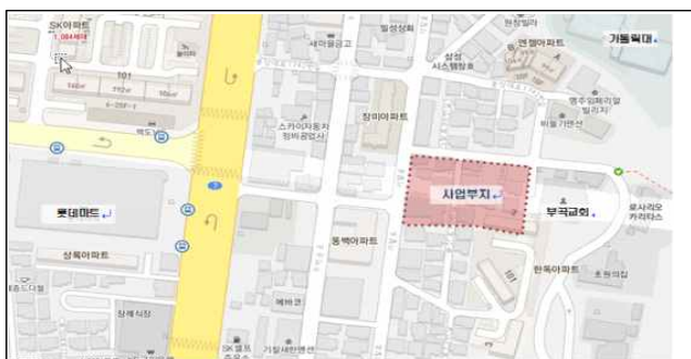
금섬 공영주차장 위치도