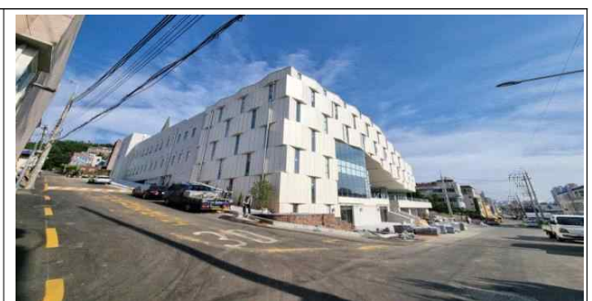
금섬 공영주차장 현장사진('21.8.5. 준공)