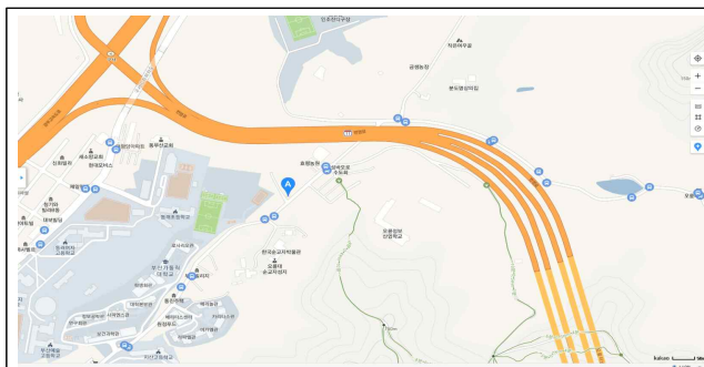
오륜동 주차장 위치도