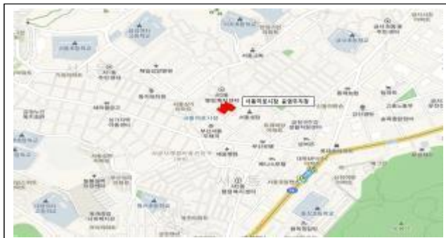
서동미로시장 공영주차장 위치도