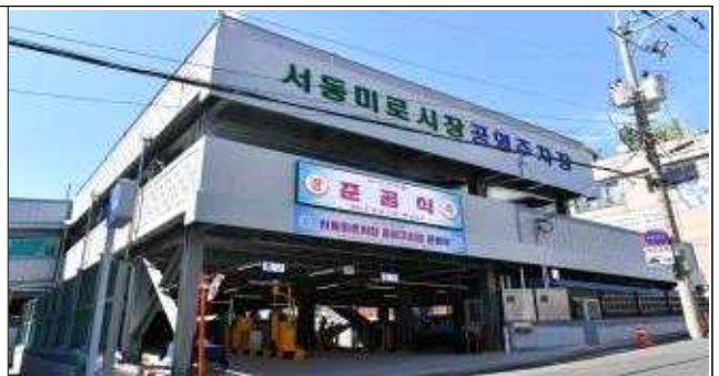
서동미로시장 공영주차장('20.5.20. 준공)