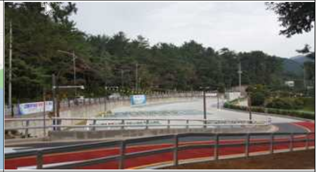
선동주차장 현장사진('19.9.26. 준공)