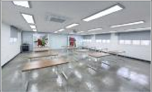
황산도 금정쉼터 내부(2층)