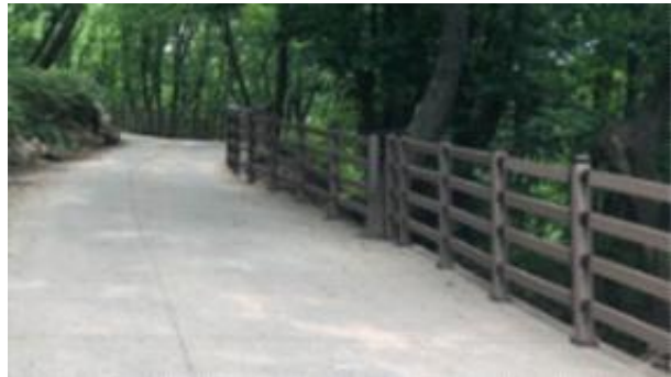
2019. 숲길정비(데크철거, 남문 입구)