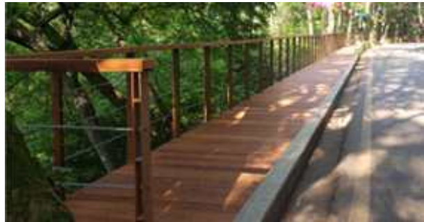
2018. 숲길정비(데크교체, 범어사 상행로)