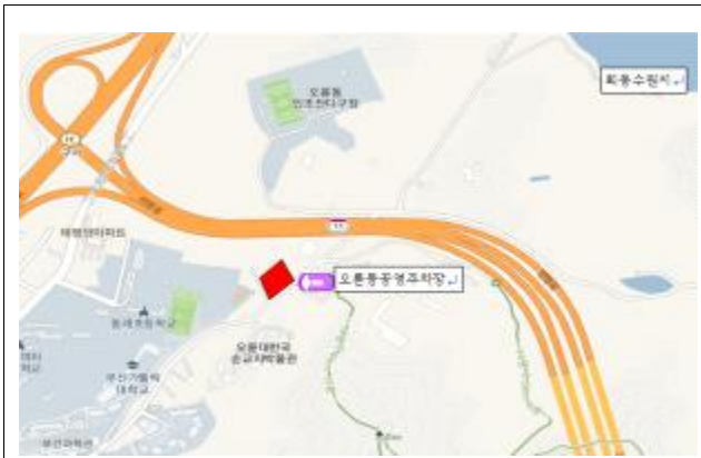
오륜동 주차장 위치도