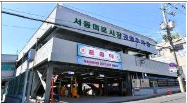
서동미로시장 공영주차장('20.5.20. 준공)