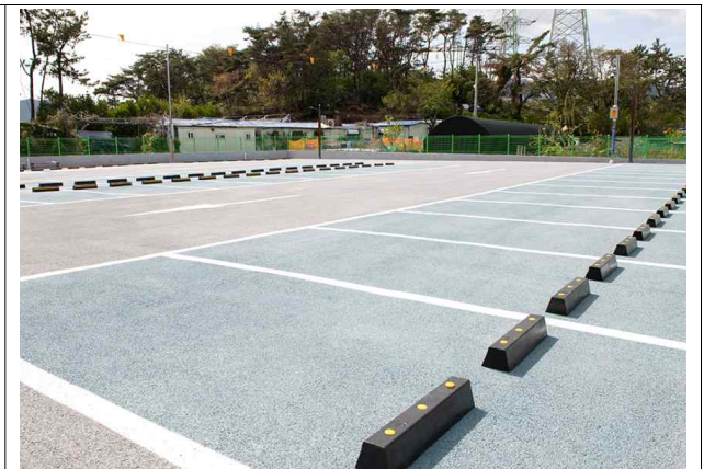
오륜동 주차장 현장사진('21.4. 준공)