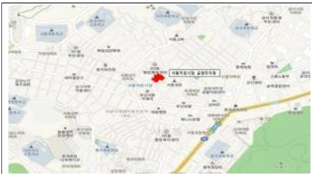
서동미로시장 공영주차장 위치도