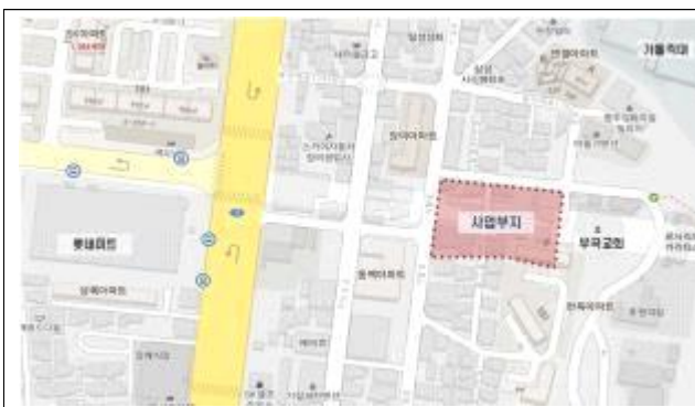
금샘 공영주차장 위치도