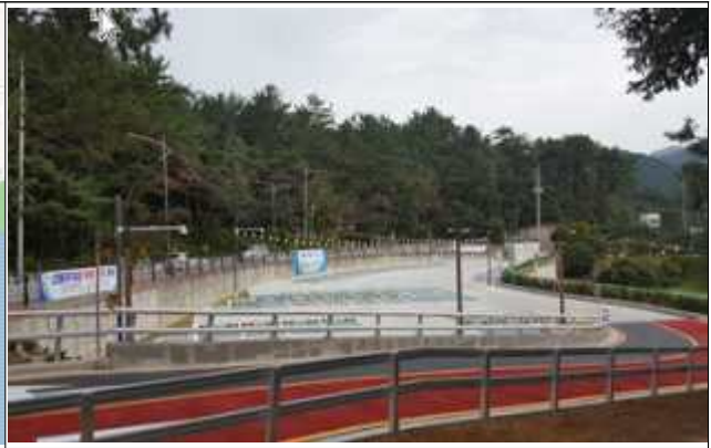
선동주차장 현장사진('19.9.26. 준공)