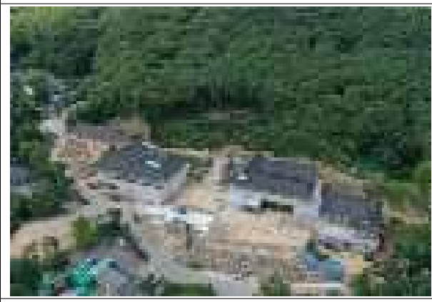
범어사 선문화교육센터·템플스테이관 준공