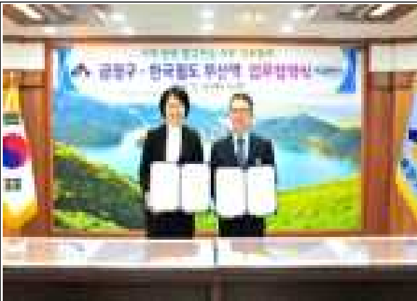
한국철도 부산역 업무협약 체결