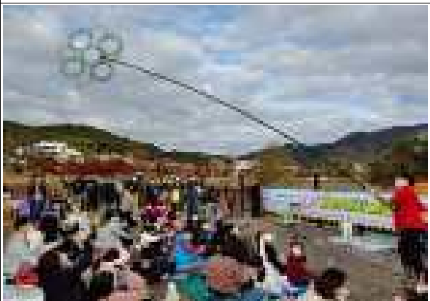
생태테마 관광사업-회동수원지 소풍여행