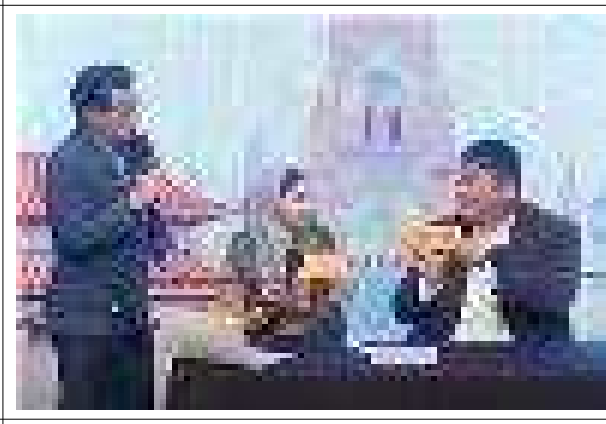
2020 온라인 종교힐링 문화축제