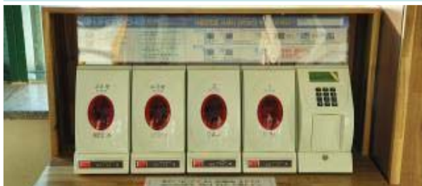
휴대폰 충전기 설치