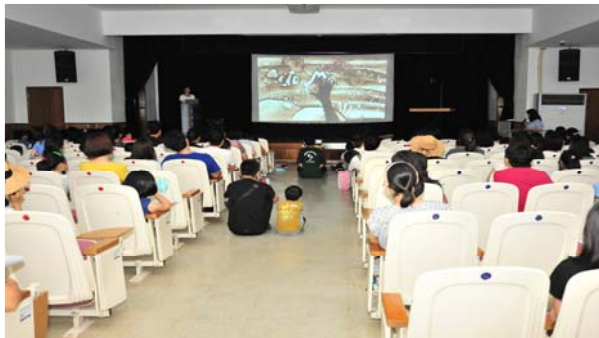
샌드 아트 공연