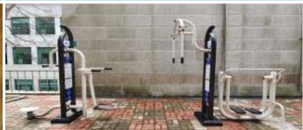
야외쉼터 운동기구 설치