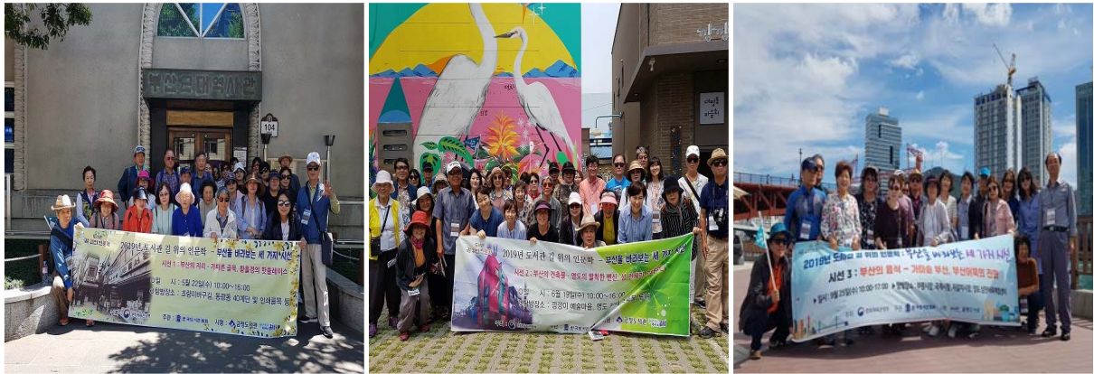
길 위의 인문학(1,2,3차)