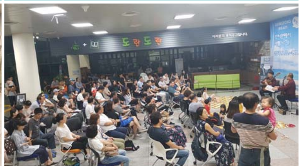
폴리포니 듀오 콘서트