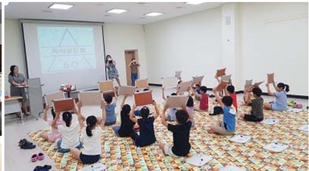
어린이 독서 골든벨