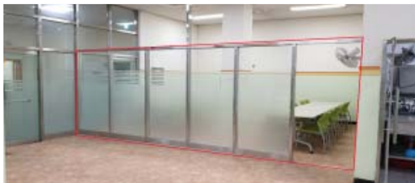
이용자 휴게시설 설치