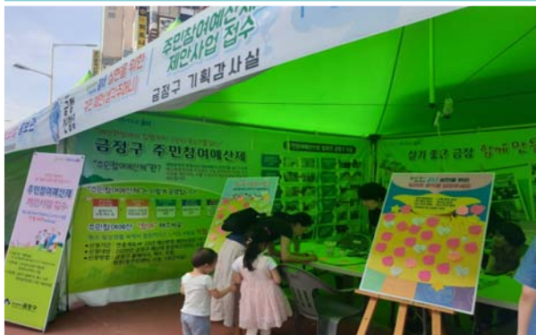
홍보부스 운영 모습