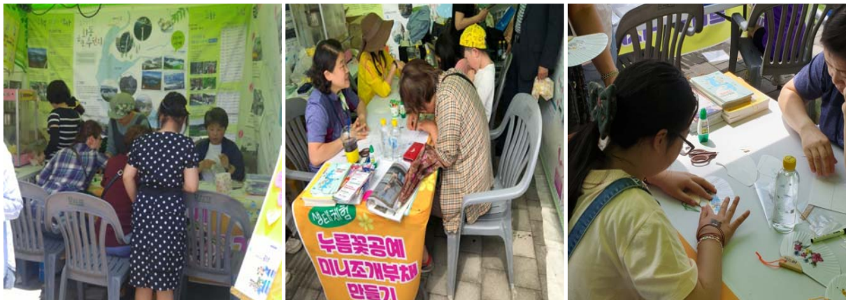
독서문화 프로그램 운영(스칸디아 콜라주액자 만들기) ↘