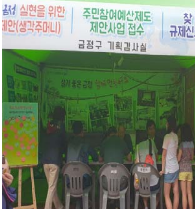
주민참여예산제도 홍보 ↘