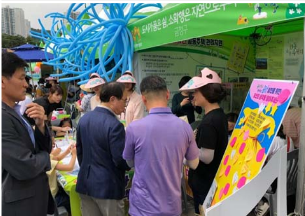
시장님 방문(부스 순회) ↘