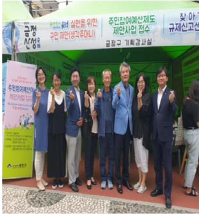
주민참여위원 참여 ↘