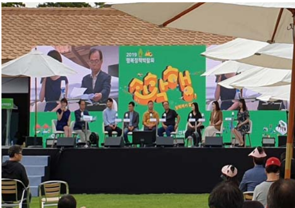
소확행 토크쇼(시장님 진행) ↘