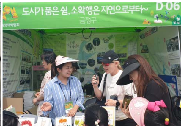
인터뷰(외국계 언론매체) ↘