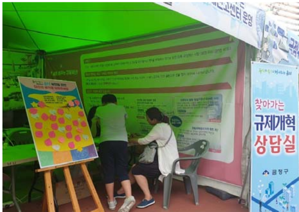
규제개혁 주민의식 설문조사 ↘