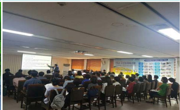
예산학교 운영 모습