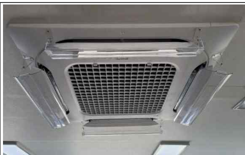
실내기 외부 디스펜서