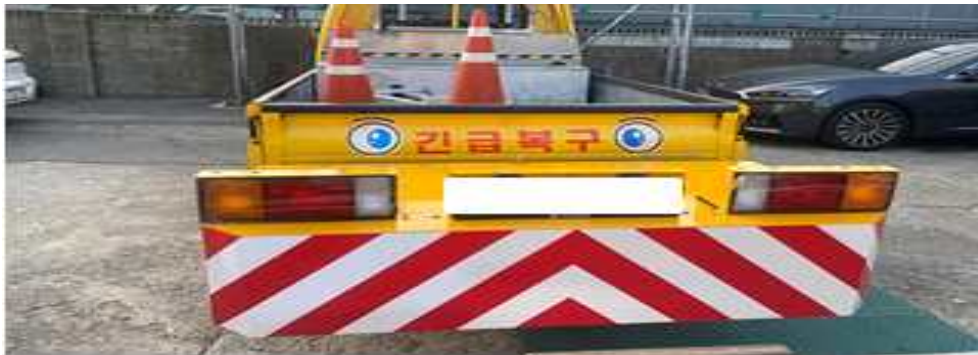
현재 사용중인 차량충격 흡수장치