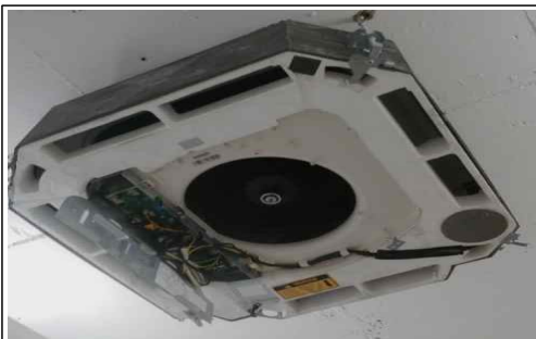
실내기 내부 팬