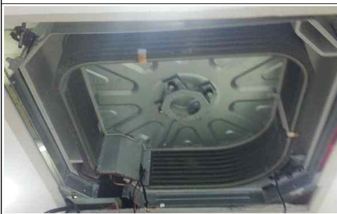
실내기 내부 열교환기