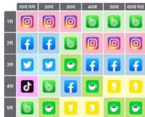
< 연령별 TOP5 (22년 02월 기준) >