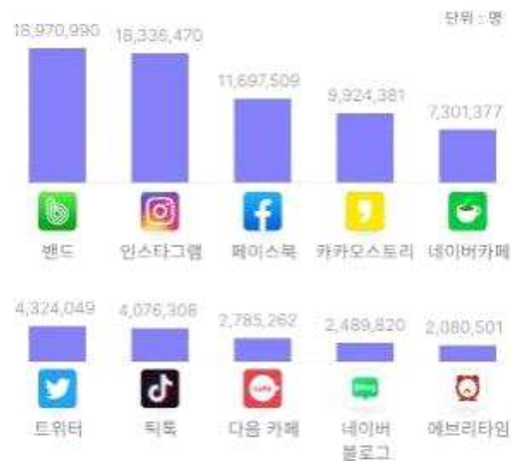
< SNS 앱 사용자 TOP10 (22년 02월 기준) >