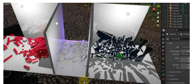
< 메타버스 중력/충돌 상호작용 >