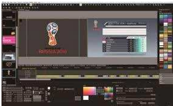
< 유튜브 영상 편집 (후반작업 CG) >