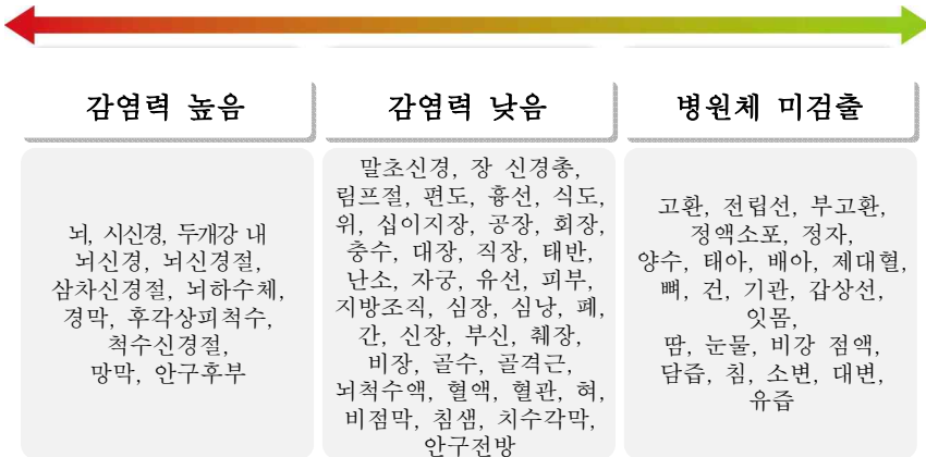
그림 1 | 인체 조직 부위별 감염력 비교

※ 감염력이 없는 검체(타액, 외분비물, 대·소변 등)에 대한 특별관리 불필요