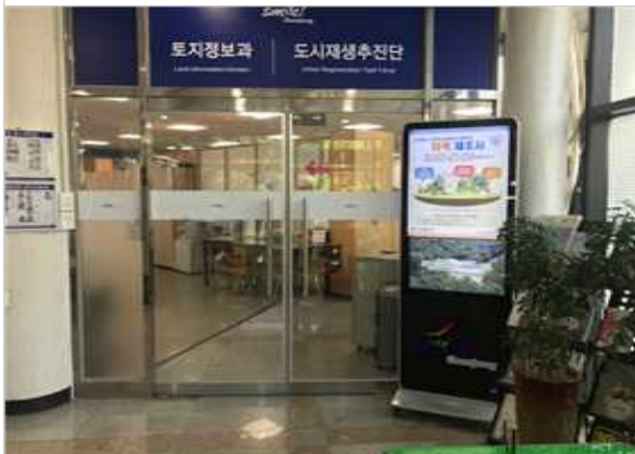
금정산성 축제 홍보부스 운영