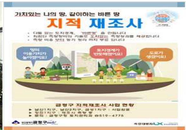
홍보영상물 활용한 교육(두실초등학교)