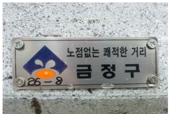
【운모화분 개별 표찰 부착】