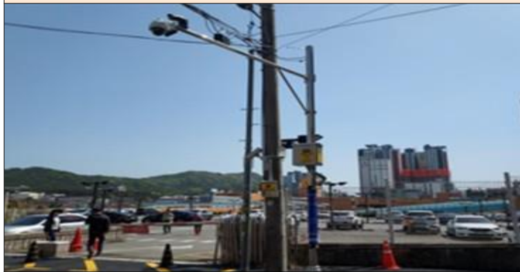
이마트 옆 CCTV 설치