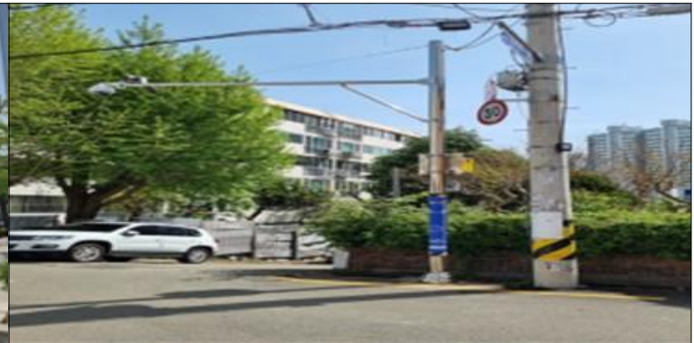
현대자동차 금정지점 뒤 CCTV 설치