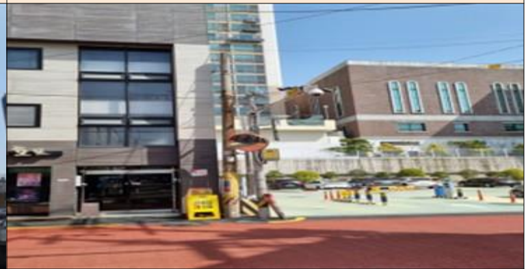
삼성맨션 앞 CCTV 보강