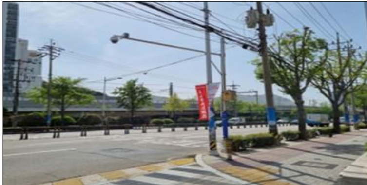
현대자동차 금정지점 앞 CCTV 설치