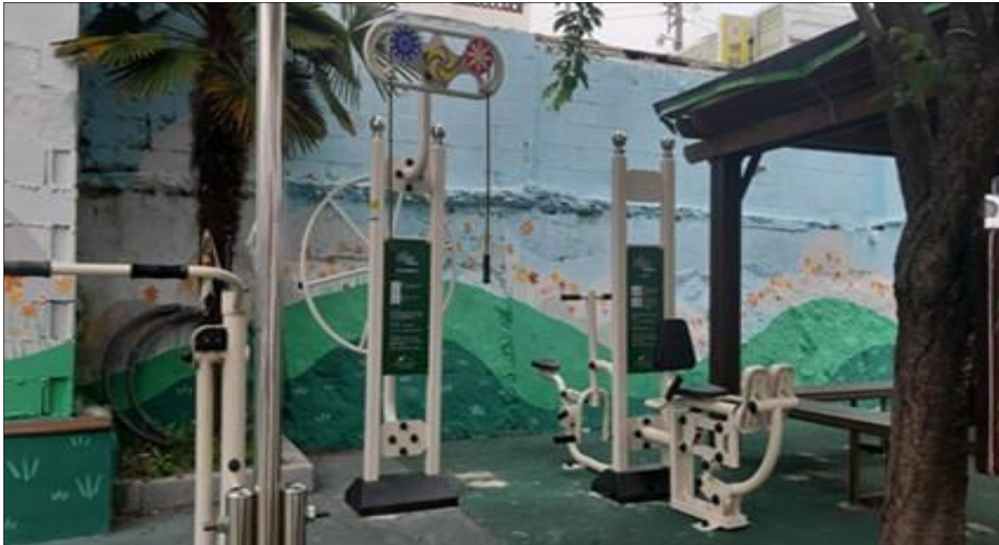
노젓기 + 다리뻗치기 1종 2점 설치